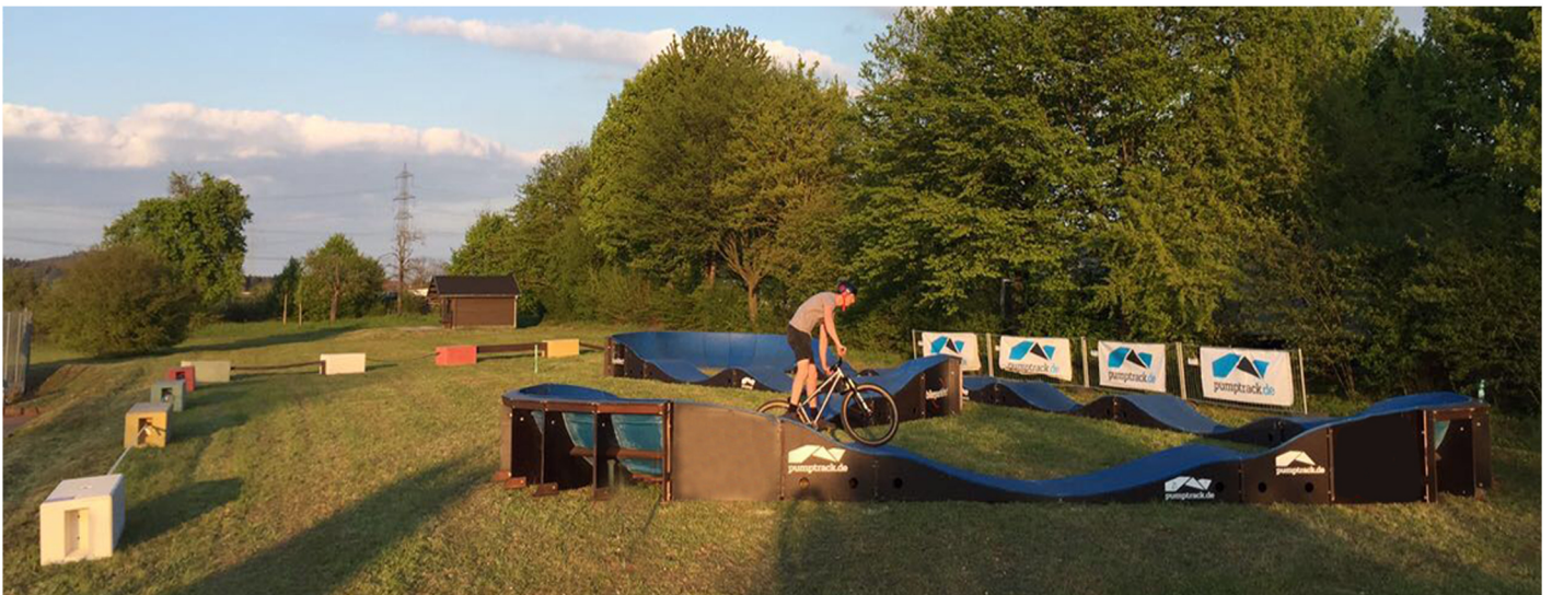
Als Praxis-Beispiel: Der Pumptrack mit Bloacs-Slackline Steinen im Mai 2017 in Ludwigsburg.

Soll die Aufstellung im Innenbereich erfolgen muß dieser mit einem Gabelstapler befahrbar sein. Für den Materialcontainer ist eine Fläche von (BxHxT) 2,5x2,5x6m oder 2,5x2,5x3m vorzusehen.